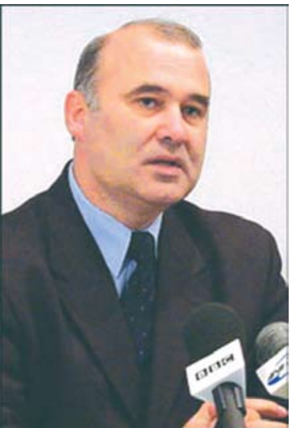
Victor ȘTEPANIUC, Viceprim-ministru al Republicii Moldova