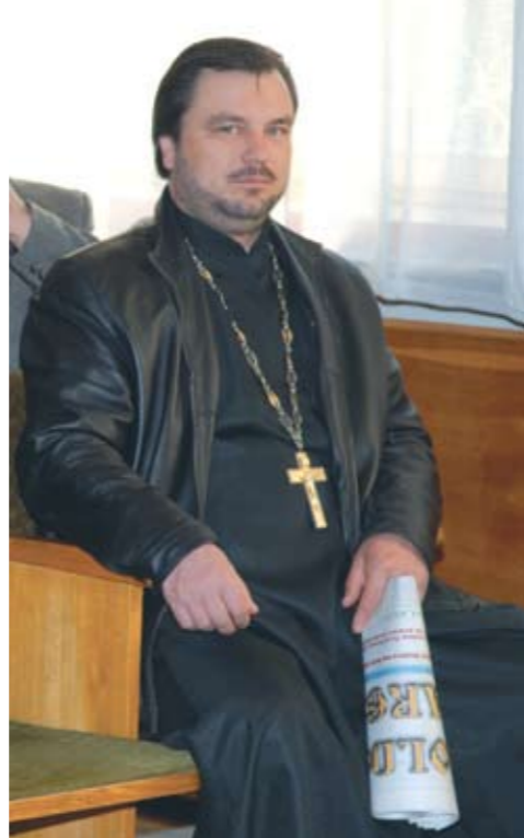
Parohul Bisericii Patriarhale Stavropighiale Sf. Dumitru de Solun din s.Speia, Gheorghe (Paladaiciu)

pricopsi cu o nouă „provincie”. Domnia sa a declarat: „Pentru moldoveni dragostea de țară, plecăciunea pentru ocina strămoșească, patriotismul sînt simțăminte sfinte. Cuvîntul